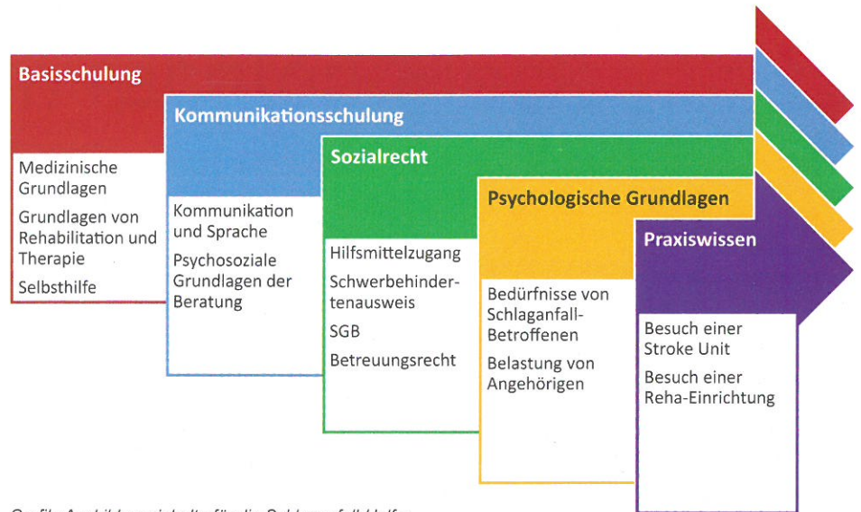
Grafik: Ausbildungsinhalte für die Schlaganfall-Helfer